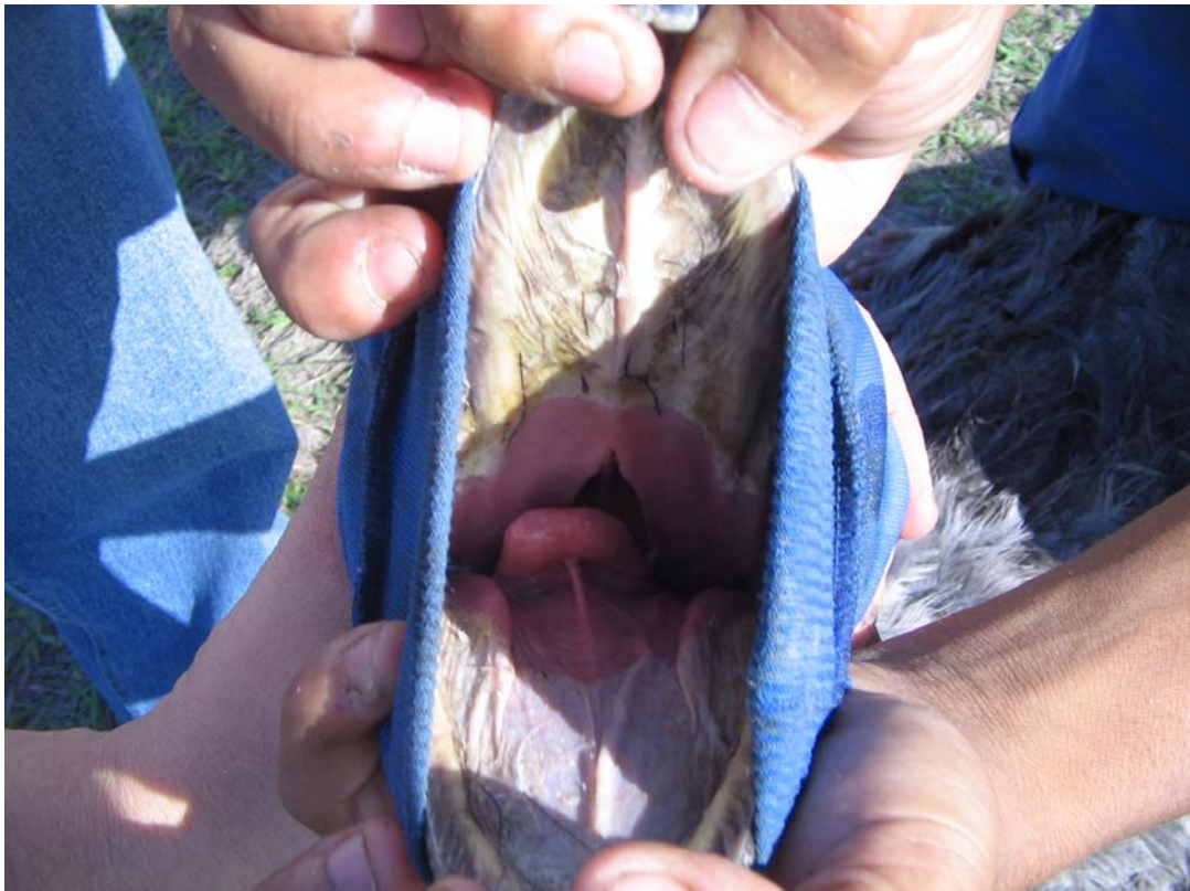
Figura 7. Orofaringe do animal.