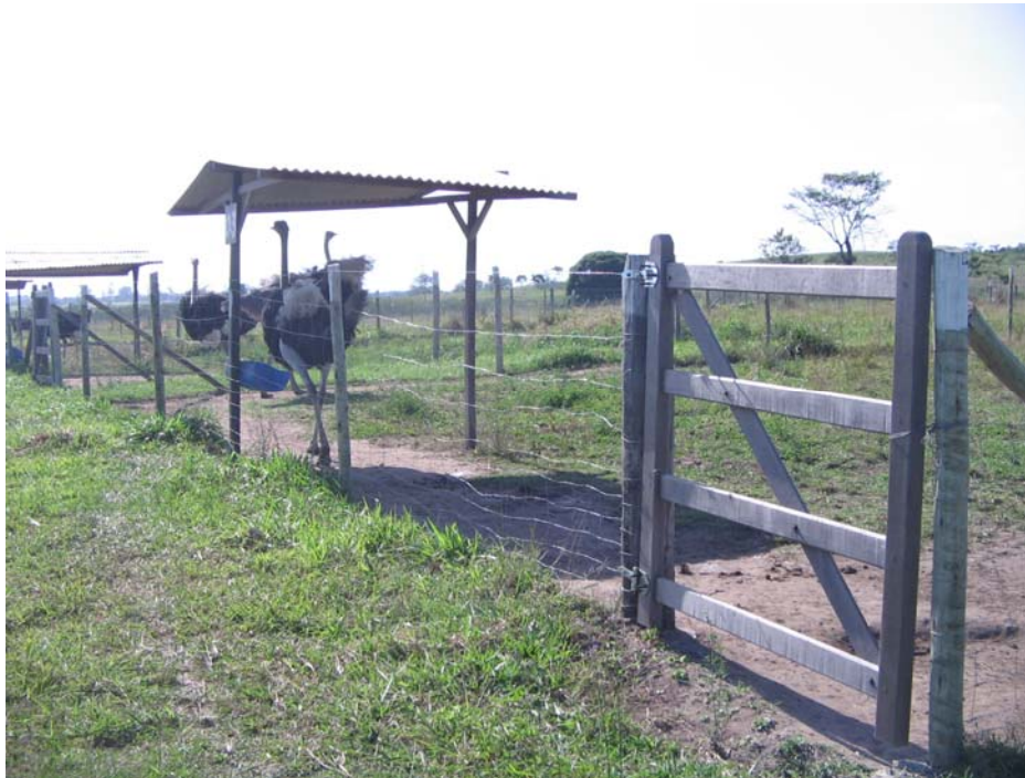
Figura 1. Vista parcial dos animais reprodutores no criatório de avestruzes localizado no município de Itaboraí-RJ.