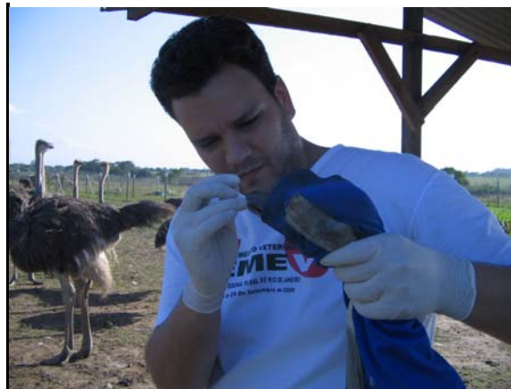
Figura 5 e 6. Coleta de material, introdução do swab na orofaringe e realização de movimentos rotatórios no interior da cavidade.