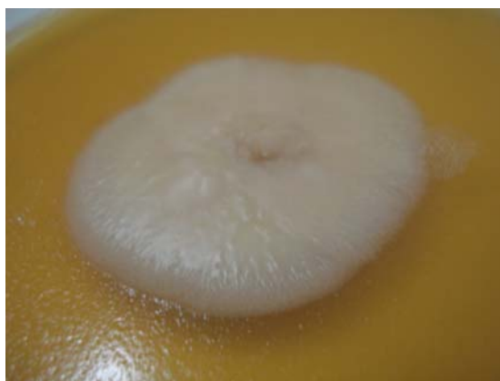
Figuras 11 e 12. Amostra semeada em Agar Fosfolipase.