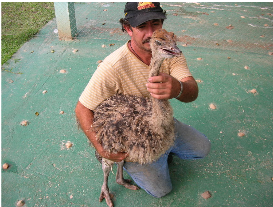
Figura 4. Contenção manual das patas e pescoço de um filhote, macho, de aproximadamente 2 meses de idade.