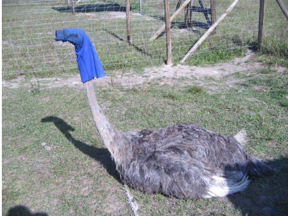
Figura 3. A avestruz fêmea jovem, com aproximadamente 18 meses, contida com o "capuz".