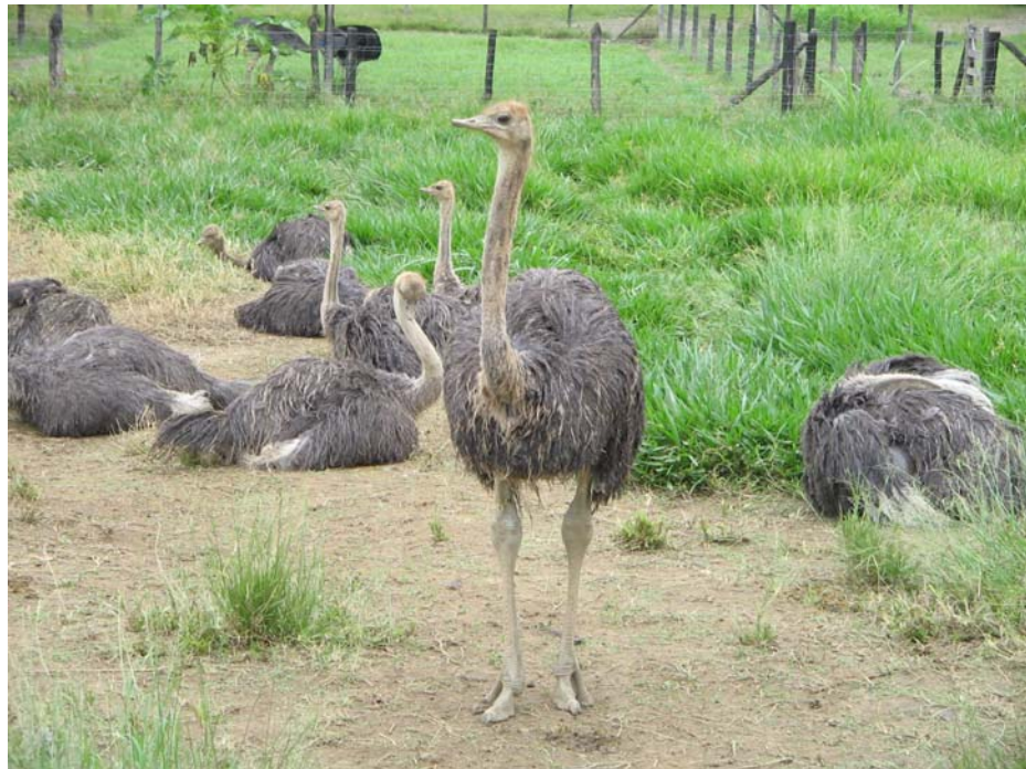
Figura 2. Vista parcial dos animais jovens, com idade compreendida entre 3 e 6 meses no criatório de avestruzes localizado no município de Magé-RJ.