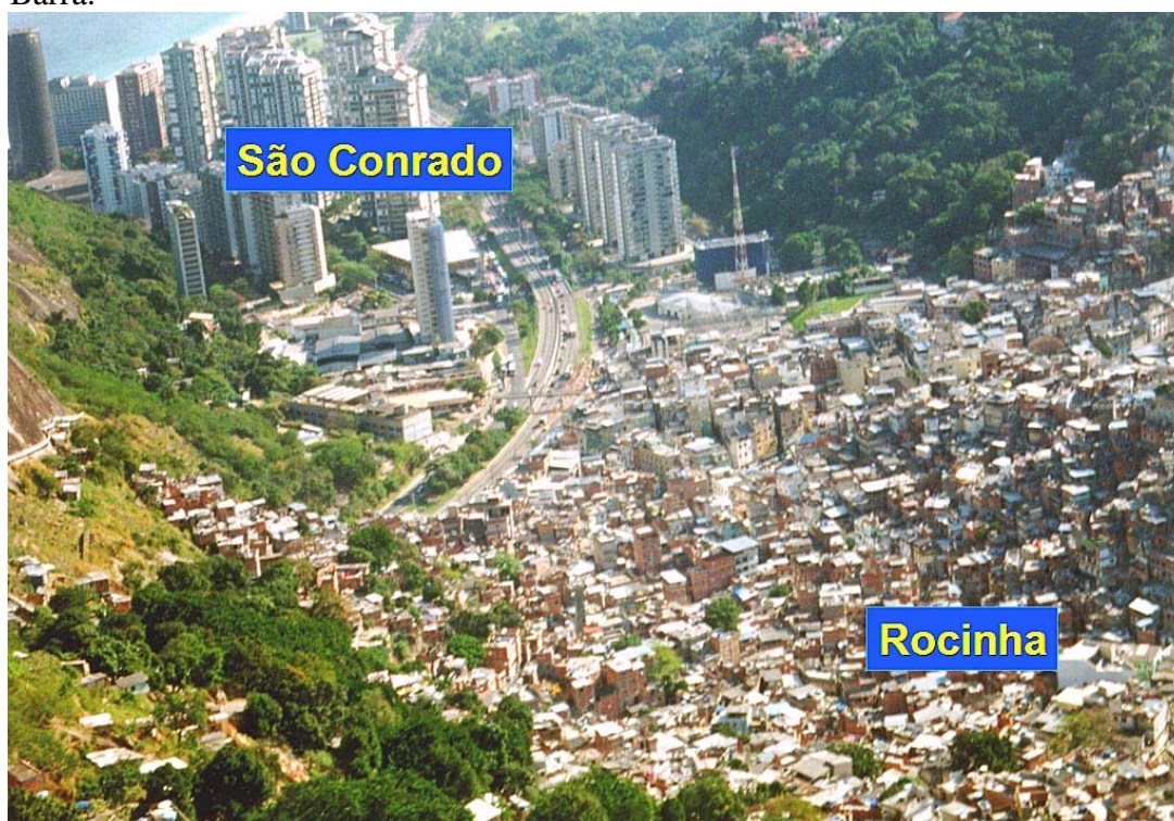
Foto de Isnard Tomas Martins, maio 2003. SESP / Instituto de Segurança Pública – ISP

Na foto, a parte baixa da Rocinha e São Conrado, separados pela auto-estrada Lagoa-Barra.